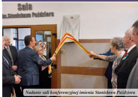
Nadanie sali konferencyjnej imienia Stanisława Paździóra