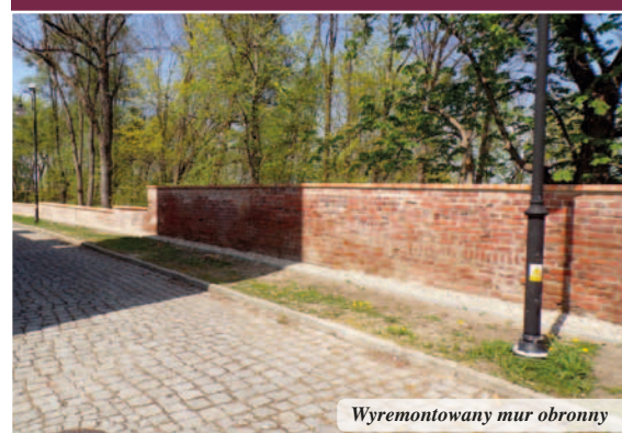
Wyremontowany mur obronny