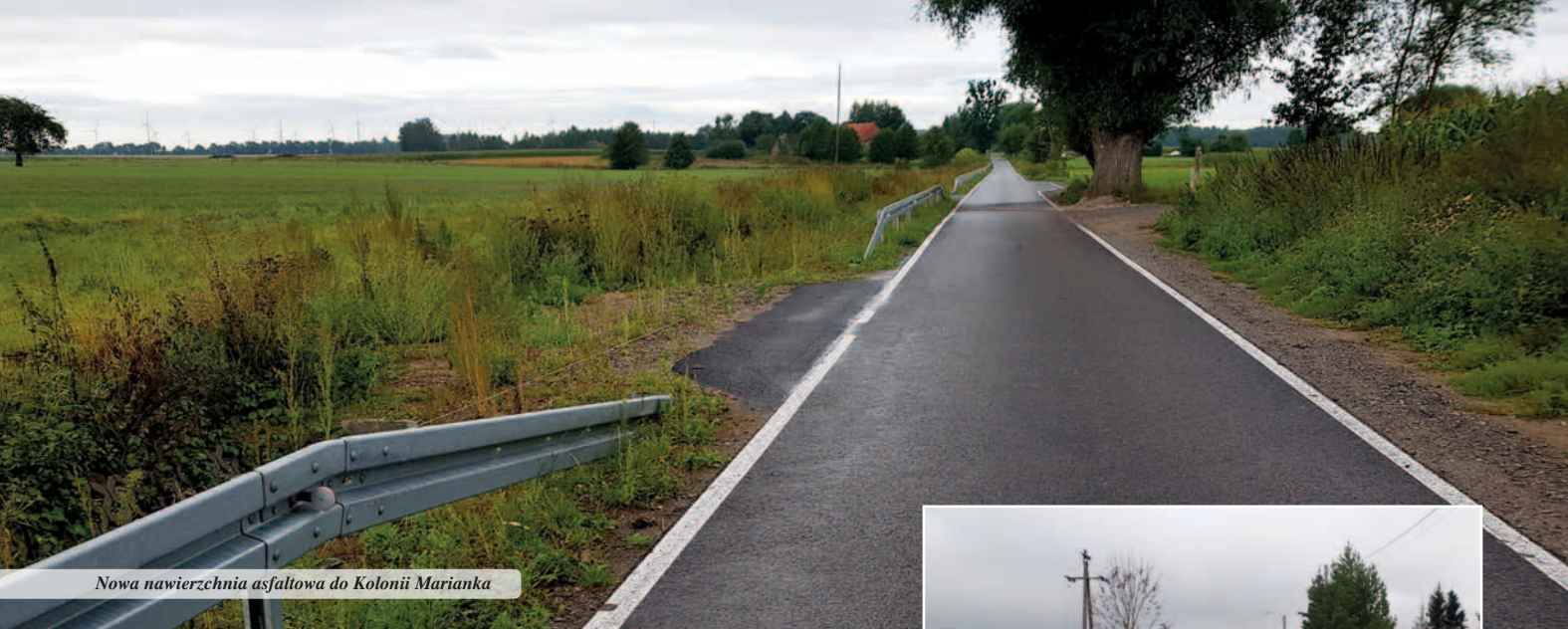
Nowa nawierzchnia asfaltowa do Kolonii Marianka