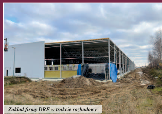
Zakład firmy DRE w trakcie rozbudowy

Mickiewicza, Kopernika, Osińskiego i Jagielly na skrzyżowanie o ruchu okrężnym (rondo). W ramach realizowanego zadania zaplanowana została również przebudowa sieci wodociągowej, kanalizacji sanitarnej, burzowej w tym budowa dwóch separatorów związków ropopochodnych, przebudowa oświetlenia drogowego, przebudowa kolizji sieci urządzeń telekomunikacyjnych i energetycznych. W roku 2022 zakończono część prac w ramach I etapu zadania, tj. na odcinku od mostu na rzecze Wąskiej poprzez skrzyżowanie z ul. Zamkową do Szlaku św. Józefa z przyległymi drogami dojazdowymi. Pozostałe prace w ramach zadania zostaną wykonane do 30 lipca 2023 r. Na realizację przedmiotowego zadania gmina Pasłęk otrzymała dofinansowanie z Rządowego Funduszu POLSKI ŁAD: Program Inwestycji Strategicznych – 1 Edycja, w kwocie 13 270 654,50 zł. Całkowity koszt robót budowlanych wyniesie 15 016 793,25 zł.