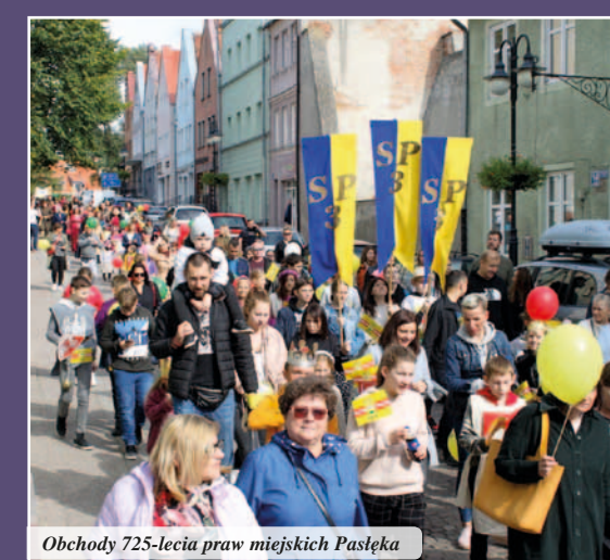
Obchody 725-lecia praw miejskich Pasłęka