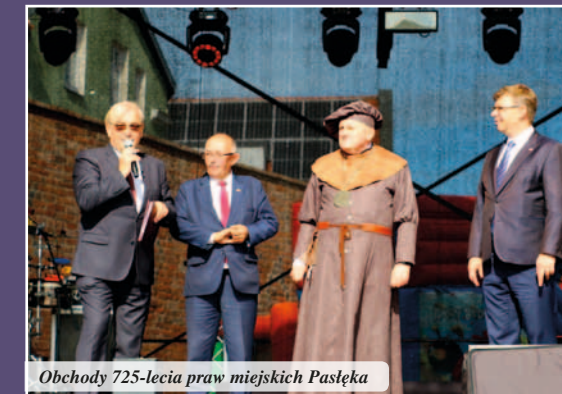
Obchody 725-lecia praw miejskich Pasłęka