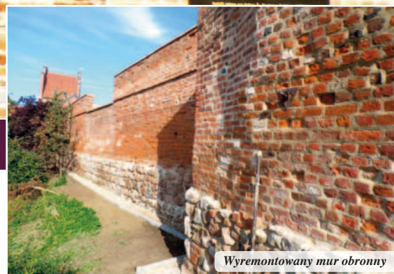
Wyremontowany mur obronny

Zakres rzeczowy zadania dotyczy przebudowy ulic A. Steffena i ks. F. Osińskiego, przyległych do ww. ulic dróg wewnętrznych oraz przebudowy skrzyżowania ulic