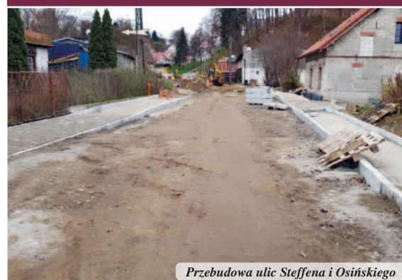
Przebudowa ulic Steffena i Osińskiego