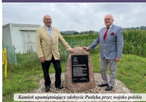
Kamień upamiętniający zdobycie Pasłęka przez wojsko polskie