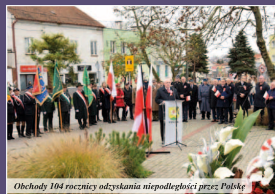
Obchody 104 rocznicy odzyskania niepodległości przez Polskę