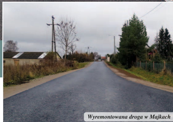
Wyremontowana droga w Majkach

Wykonano nową nawierzchnię o długości około 1350 m i szerokości 4 m. Przedsięwzięcie zostało wykonane w związku z pracami gwarancyjnymi związanymi z budową Farmy Wiatrowej Kąty w części obrębu Majki, Gryżyna i Kielminek, której inwestorem jest Spółka Baltic Green I z siedzibą w Warszawie.