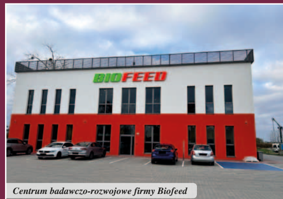
Centrum badawczo-rozwojowe firmy Biofeed