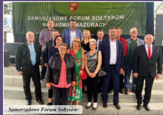
Samorządowe Forum Sołtysów