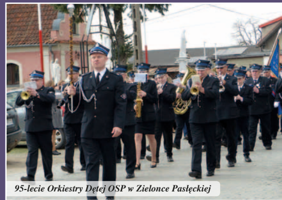
95-lecie Orkiestry Dętej OSP w Zielonce Pasłęckiej