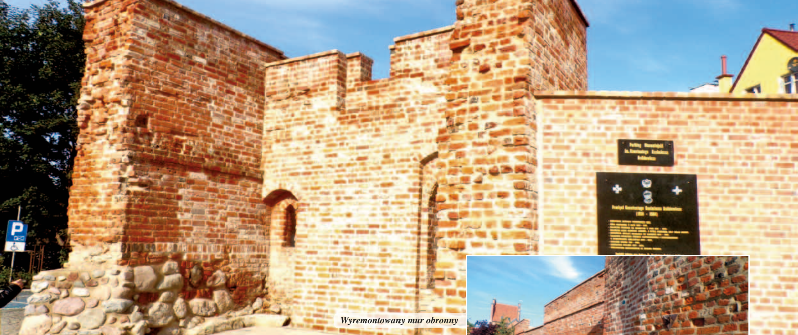
Wyremontowany mur obronny