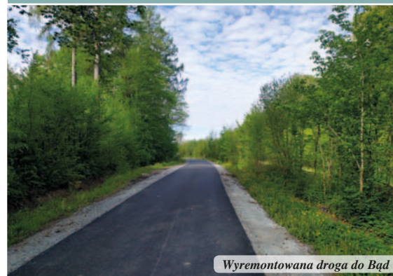
Wyremontowana droga do Bąd