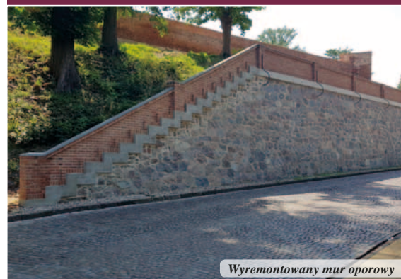
Wyremontowany mur oporowy