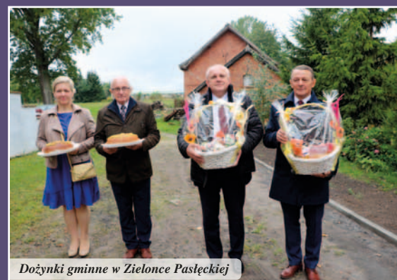
Dożynki gminne w Zielonce Pasłęckiej