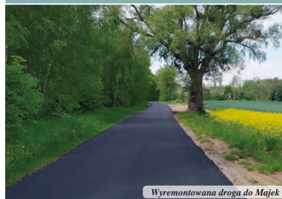
Wyremontowana droga do Majek