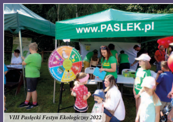
VIII Pasłęcki Festyn Ekologiczny 2022