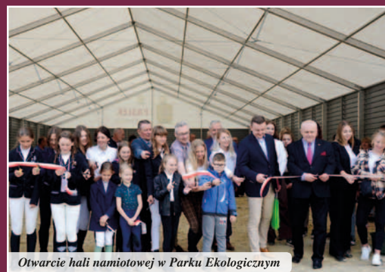
Otwarcie hali namiotowej w Parku Ekologicznym