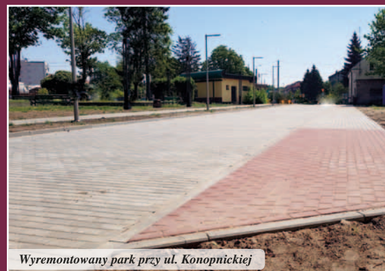
Wyremontowany park przy ul. Konopnickiej