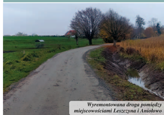
Wyremontowana droga pomiędzy miejscowościami Leszczyna i Aniołowo