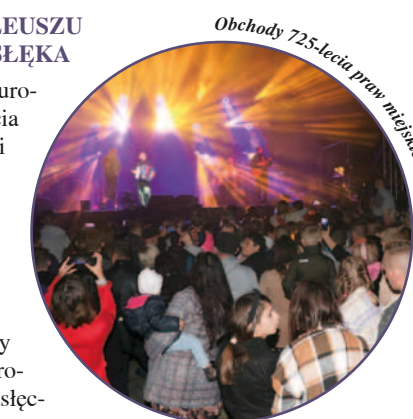
Obchody 725-lecia praw miejskich Pasłęka

W dniu 24 września 2022 r. odbyły się uroczystości z okazji Jubileuszu 725-lecia praw miejskich Pasłęka. Uroczystości rozpoczęły się Mszą Świętą w intencji mieszkańców Pasłęka w kościele św. Bartłomieja. Następnie mieszkańcy naszej gminy i zgromadzeni goście przemaszewali paradnym orszakiem ulicami starego miasta na Parking Staromiejski przy ul. Jagielly, gdzie odbywały się główne uroczystości. W ramach programu artystycznego uczniowie z pasłęckich szkół przygotowali ciekawe programy artystyczne, w tym inscenizację nadania praw miejskich Pasłękowi z udziałem Burmistrza Pasłęka. Przed zgromadzonymi licznymi mieszkańcami wystąpiła Orkiestra Dęta z Zielonki Pasłęckiej, zespół Pasłęczanie, Kapela SZTAMA, zespół POSTMAN. Uczestnicy uroczystości mieli okazję skorzystać z licznych atrakcji, tj. m.in. punktów gastronomicznych, stoisk z wyrobami regionalnymi, urządzeń rekreacyjnych dla dzieci. Finałem uroczystości jubileuszowych był koncert gwiazdy wieczoru, tj. zespołu „ENEJ”.