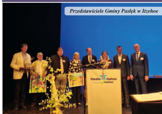
Przedstawiciele Gminy Pasłęk w Itzehoe