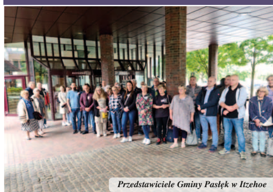
Przedstawiciele Gminy Pasłęk w Itzehoe