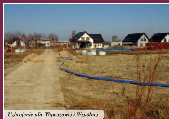
Uzbrojenie ulic Wąwozowej i Wspólnej