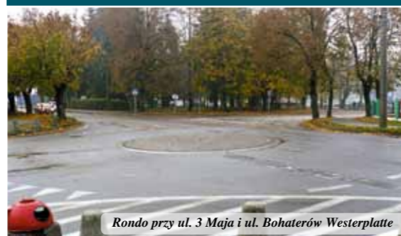
Rondo przy ul. 3 Maja i ul. Bohaterów Westerplatte