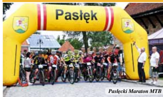
Pasłęcki Maraton MTB