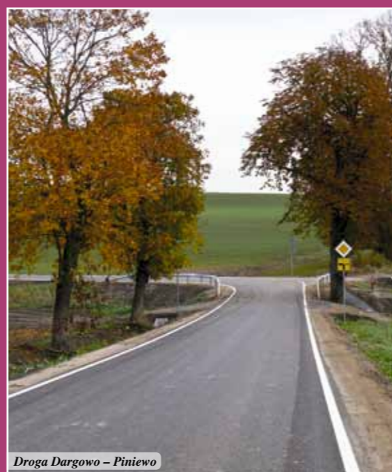
Droga Dargowo – Piniewo