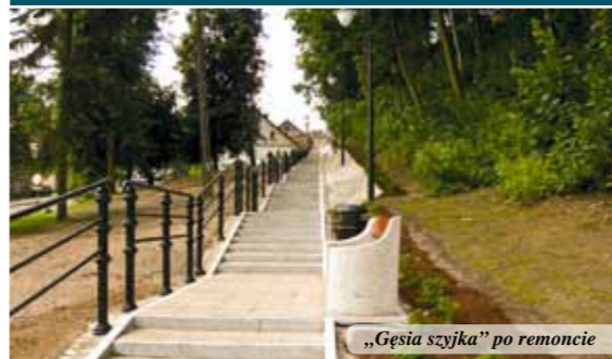
„Gęsia szyjka” po remoncie