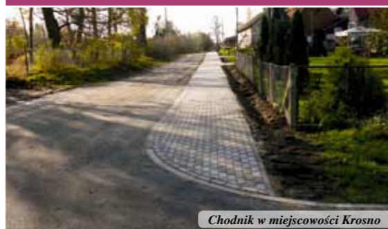
Chodnik w miejscowości Krosno