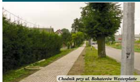
Chodnik przy ul. Bohaterów Westerplatte