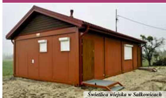
Świetlica wiejska w Salkowicach