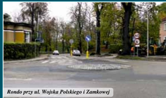
Rondo przy ul. Wojska Polskiego i Zamkowej