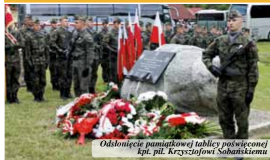
Odsłonięcie pamiątkowej tablicy poświęconej kpt. pil. Krzysztofowi Sobańskiemu