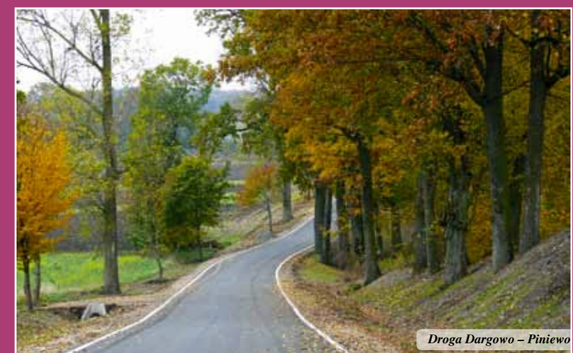
Droga Dargowo – Piniewo

Zadanie dotyczyło budowy jezdni asfaltowej o szerokości 5 m od skrzyżowania z drogą powiatową w miejscowości Dargowo do końca wsi Piniewo oraz dróg wewnętrznych w Piniewie o nawierzchni asfaltowej o szerokości 4,5 m. Łącznie przebudowano odcinek o długości ponad 2,3 km. Przebudowano przepusty pod drogą oraz oczyszczono rowy. W Piniewie wykonany został chodnik z kostki betonowej o łącznej powierzchni 451 m 2 oraz przystanek autobusowy z wiatą przystankową. W ramach zadania przebudowano zjazdy o nawierzchni bitumicznej o łącznej powierzchni 394 m 2 na przyległe pola oraz zjazdy na posesję z kostki betonowej o łącznej powierzchni 285 m 2 . Wprowadzono nową organizację ruchu w postaci oznakowania poziomego i pionowego. Koszt robót budowlanych zgodnie z umową wyniósł 2.689.169,87 zł. Ogólny koszt zadania wyniósł ponad 2,8 mln zł. Pasłęcki samorząd na realizację zadania pozyskał dofinansowanie z Funduszu Dróg Samorządowych w kwocie 1.233.592,73 zł.