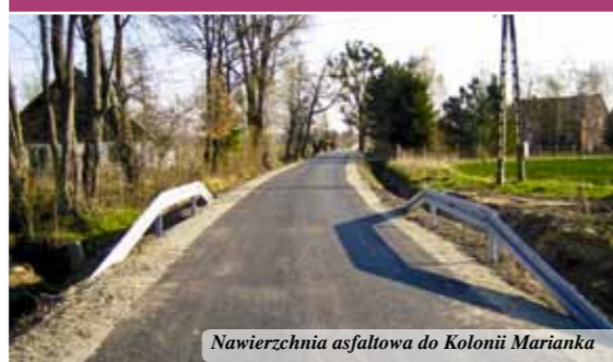
Nawierzchnia asfaltowa do Kolonii Marianka