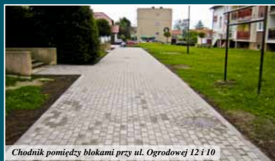
Chodnik pomiędzy blokami przy ul. Ogrodowej 12 i 10