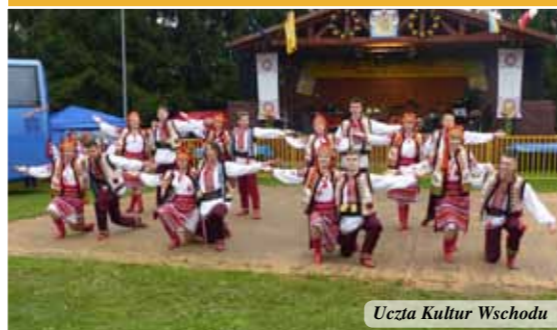
Uczta Kultur Wschodu