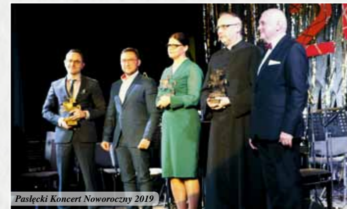
Pasłęcki Koncert Noworoczny 2019

W dniach od 19 do 28 maja 2019 r. w Pasłęckim Ośrodku Kultury odbyła się „VIII Pasłęcka Wiosna Teatralna”. W tegorocznej edycji wśród spektakli w wykonaniu aktorów Teatru im. Aleksandra Sewruka w Elblągu oraz Olsztyńskiego Teatru Lalek znalazły się: „Mayday 2”, „Szalapatki”, „Petit Pierre”.