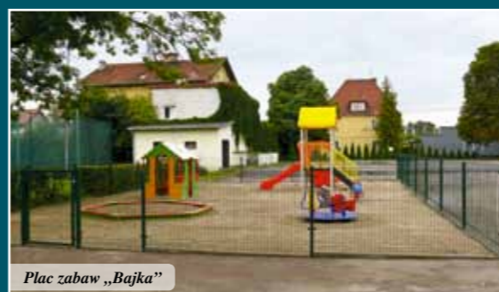
Plac zabaw „Bajka”