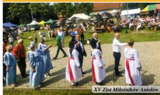
XV Złot Miłośników Aniołów