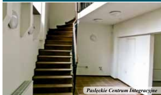
Pasłęckie Centrum Integracyjne