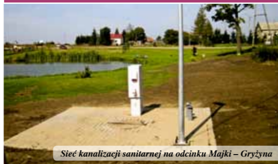
Sieć kanalizacji sanitarnej na odcinku Majki – Gryżyna

W ramach zadania powstała ścieżka rowerowa wraz z dojazdami o łącznej powierzchni 200,43 m 2 i długości około 120 m. Koszt wykonania zadania wyniósł 39.900,88 zł. Zadanie zostało wyłonione do realizacji w ramach budżetu obywatelskiego Gminy Pasłęk na 2019 rok, uzyskując wśród projektów zlokalizowanych na terenach wiejskich gminy Pasłęk 492 głosy ważne oddane na projekt, tj. trzecie miejsce.