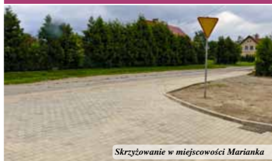
Skrzyżowanie w miejscowości Marianka