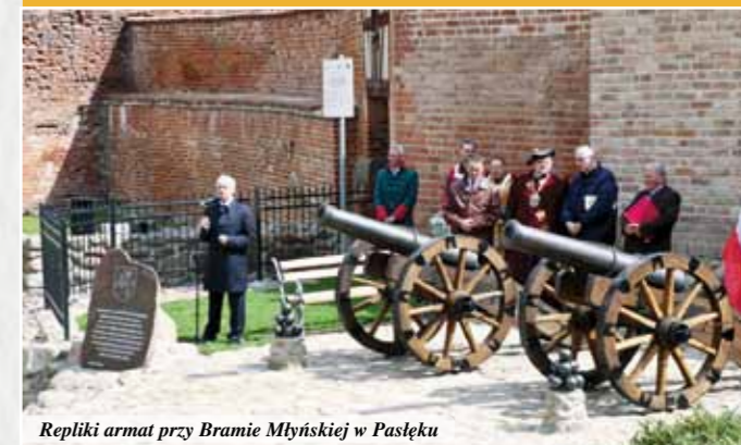
Repliki armat przy Bramie Młyńskiej w Pasłęku