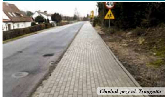
Chodnik przy ul. Traugutta