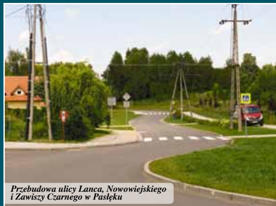
Przebudowa ulicy Lanca, Nowowiejskiego i Zawiszy Czarnego w Pasłęku

Prace w ramach inwestycji prowadzone były od kwietnia 2018 r. do końca czerwca 2019 r. Zadanie uzyskało dofinansowanie w kwocie 656.800,00 zł w ramach Rządowego Programu na rzecz Rozwoju oraz Konkurencyjności Regionów poprzez Wsparcie Lokalnej Infrastruktury Drogowej. Całkowity koszt zadania wyniósł ponad 1.650.000 tys zł.