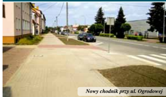
Nowy chodnik przy ul. Ogrodowej

W ramach zadania wykonano nowy chodnik z kostki betonowej o powierzchni około 112 m 2 . Wartość zadania wyniosła 25.000,00 zł.