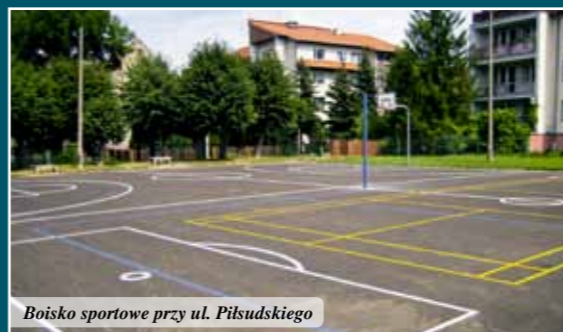
Boisko sportowe przy ul. Piłsudskiego