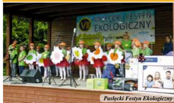
Pasłęcki Festyn Ekologiczny

W ramach tego przedsięwzięcia w kościele św. Bartłomieja w Pasłęku w okresie od 15 czerwca do 19 października 2019 r. odbył się cykl koncertów organowych na zabytkowych organach Andreasa Hildebrandta. W koncertach udział wzięli zarówno polscy jak i zagraniczni artyści.