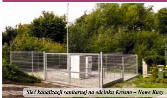
Sieć kanalizacji sanitarnej na odcinku Krosno – Nowe Kusy